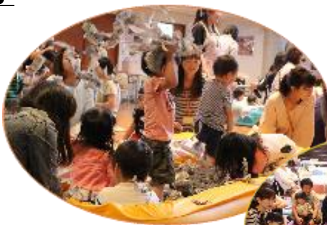
*親子でワクワク 楽しく遊びましょう!