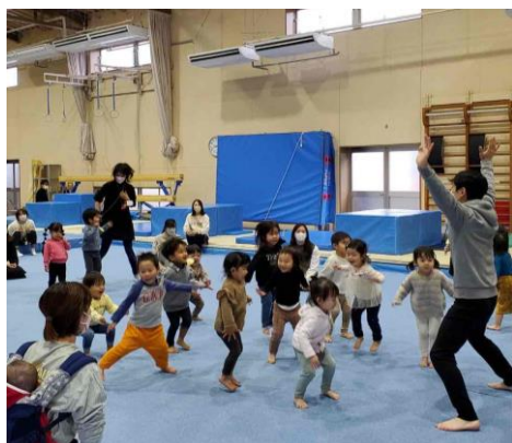
*パノラマホールで体を思いきり動かそう!